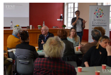
Le réseau des jardins nourriciers du Pays Terres de Lorraine réuni en séminaire pour réfléchir à une transition alimentaire pour tous.

ou des possibilités de jardins nourriciers en pied d'immeubles. ■