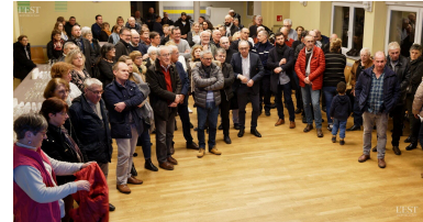
Une assemblée attentive aux annonces du maire.

duction du coût de l'éclairage public, installation de panneaux solaires sur les bâtiments communaux, passage aux leds pour l'éclairage des « Jardins du Madon ». La vidéo surveillance et la réduction de la vitesse à 30km/h sont à l'ordre du jour pour 2023. De même que la pose de panneaux lumineux d'information et la rénovation de l'école. Pour réduire la consommation d'eau, des plantes peu gourmandes embelliront le village. ■