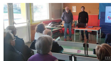
La réunion n'a attiré qu'un nombre restreint de participants.

tions de ressources. Les habitants pourront donc bénéficier d'entretiens personnalisés en mairie, uniquement sur rendez-vous, chaque 3e jeudi de chaque mois avec le référent, joignable au 06 80 75 79 89. ■