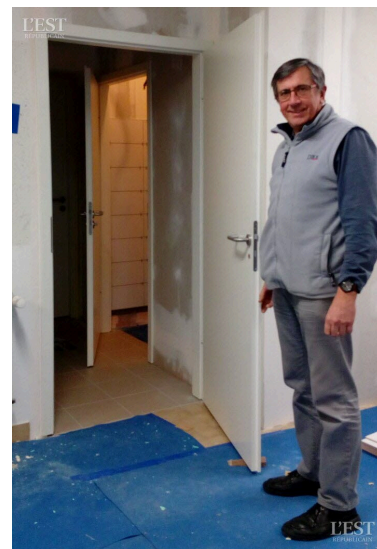
Les toilettes sont accessibles côté secrétariat et côté salle de réunion.

et horizontale. Le montant des travaux s'élève à 32 990,50 € HT. ■