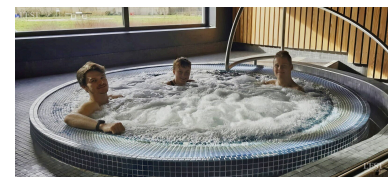
L'Aqua'mm pour fêter la Saint-Valentin autrement !

l'espace bien-être en continu tout le long de la soirée. Le tarif est de 15 € pour les habitants de la CCMM et de 18,50 € hors territoire. Réservation au 03 83 47 99 00 ou par mail aquamm@cc-mosellemadon.fr . ■