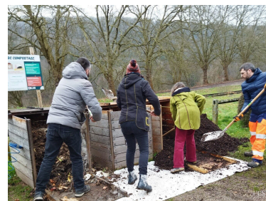
Des bacs ont été mis à disposition des habitants.

tiative de l'opération qui participe à la protection de la planète. ■