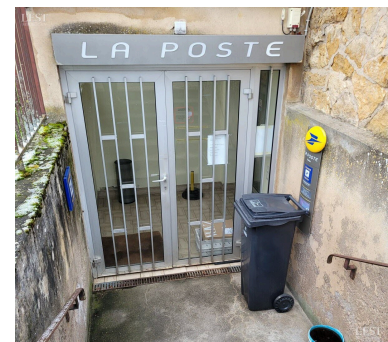
L'actuel bureau de poste, situé sous la mairie sans accès handicapé, sera transformé en agence postale communale installée au rez-de-chaussée de l'édifice.

Une possibilité est alors évoquée : l'installation des musiciens, en septembre 2023, dans un des bâtiments de l'école de Banvoie, qui sera vide du fait de la suppression d'une classe. ■