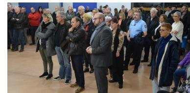
Un public nombreux à la cérémonie des vœux.

Le conseil municipal des jeunes et le conseil des ados ont été également mis à l'honneur pour leur participation, entre autres, aux commémorations du 8 mai et du 11 novembre. ■