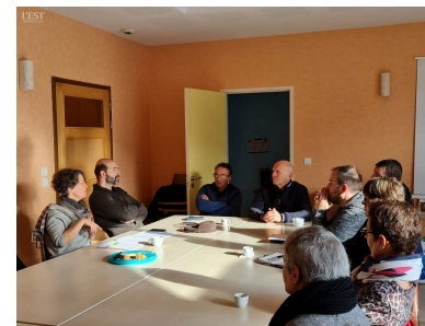
Elus, bénévoles et habitants : tous impliqués dans la démarche de transition.