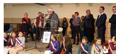
Le Conseil municipal des enfants devant les élus et politiques.

La reconnaissance du label « Petites Villes de demain » permet à la municipalité de s'engager dans la réhabilitation du parc de la mairie, projet financé à hauteur de 80 %. ■