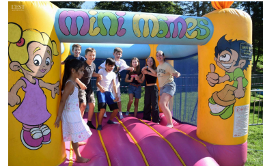
Les structures gonflables ont eu beaucoup de succès.

À la tombée de la nuit, un feu d'artifice offert par la municipalité a rassemblé un large public sous de nombreux applaudissements ! Il s'agissait du feu d'artifice qui n'avait pu avoir lieu à la fête nationale pour des raisons de sécurité liées aux risques d'incendie. ■