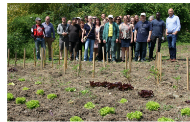
Un événement qui a permis de faire connaissance, discuter et échanger en toute convivialité.

Pour cette première rencontre, les intéressés avaient apporté et partagé des viandes à griller autour d'un barbecue géant en trinquant autour du verre de l'amitié. ■