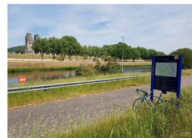
La première édition de l'événement touristique « La boucle en fête » avait installé son village sur le parvis de la cathédrale.

kayak). Du dragon boat en deux créneaux (8 h 30 et 10 h) puis du kayak à 14 h. Les sorties seront encadrées par un éducateur sportif, au départ du club, 93 rue de la baignade des chevaux à Toul. Réservations obligatoires au 06 73 02 04 48 ou sur https://tinyurl.com/2zv8s9lf . ■