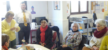
Chaque personne a pu partager ses dernières lectures.

Organisée par la Filoche et menée par des bénévoles, la rencontre à la médiathèque de Richardménil a réuni une douzaine de personnes samedi après-midi pour son « Coup de cœur café » de printemps. Le thème du jour était consacré aux nouveautés de ce début d'année. Chacun a pu ainsi présenter son roman préféré du moment et tout le monde a eu, ensuite, l'occasion de débattre tout en partageant quelques pâtisseries maison. ■