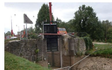
La descente de la porte de l'écluse.