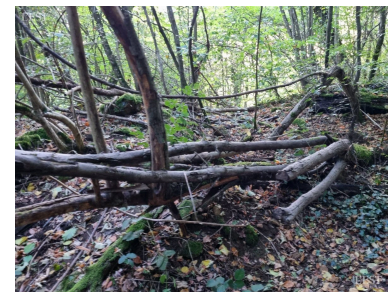
Les arbres tombés forment un habitat pour beaucoup d'animaux du Bois des Roches, qui prend le statut d'« îlot de sénescence ».

Un îlot de sénescence est une surface forestière sur laquelle les arbres peuvent accomplir leur cycle de vie naturel entier jusqu'à leur effondrement et décomposition complète. La forêt est le premier puits de biodiversité terrestre. Ces îlots contiennent une diversité biologique particulièrement riche. ■