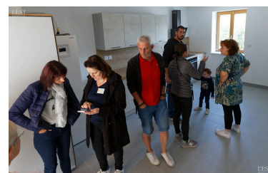
Visite des appartements.

qui permettra de lancer rapidement d'autres projets comme la réhabilitation des locaux périscolaires et la création d'un local pour un commerce de proximité. ■