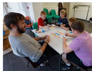
Les jeux font partie de la rencontre.

tographie. Les jeunes pourront s'inscrire aux différentes activités de l'après-midi après avoir travaillé sur le chantier photos du matin. ■