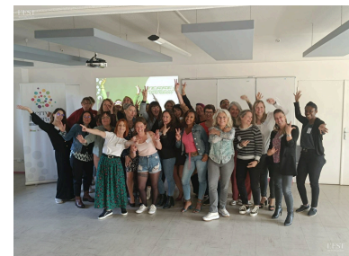
La bonne humeur est de mise pour ces femmes entrepreneuses.