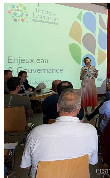
Des élus du Pays Terres de Lorraine ont posé les bases d'une gouvernance locale.

L'agence de l'eau a notamment évoqué la mise en place de Projet de Territoire pour la Gestion de l'Eau (PTGE) et surtout d'une Commission Locale de l'Eau (CLE) réunissant les différents usagers de l'eau (collectivités locales, agriculteurs, industriels, citoyens...) en vue d'anticiper les pénuries d'eau, d'engager des actions d'économie d'eau et d'un partage équitable de l'eau. ■