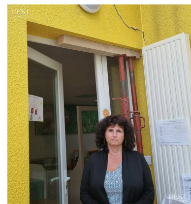
Les travaux d'extension de la maison ont notamment entraîné l'apparition de fissures, ce qui a nécessité d'étayer le mur dans le sas d'entrée.

Contactée par nos soins, la collectivité ne ferme pas la porte : « La demande pourra être étudiée. » Une petite lueur d'espoir au bout du tunnel ? ■