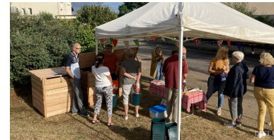
Mise en place du nouveau site rue du Petit-Avillon.