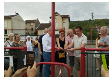
L'inauguration avec la traditionnelle découpe du ruban.

Les jeunes disent leur satisfaction de pouvoir s'adonner à leurs sports en toute sécurité. ■