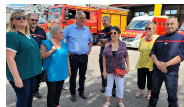
Les élus au centre de secours.

Face à l'augmentation des risques, le maire et le lieutenant Petit appellent toutes celles et ceux qui souhaiteraient s'engager parmi les pompiers volontaires à se manifester par mail : spv@sdis54.fr . ■