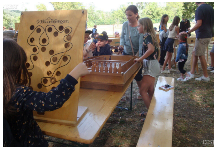
Les jeux en bois ont connu un certain succès.

Tous ces jeunes encadrés par les animateurs de CCMM, les membres de la commune et du comité interassociatif qui leur a offert des boissons ont passé une excellente après-midi. ■