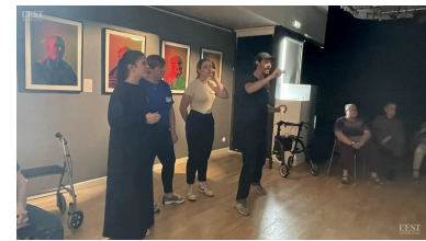
L'artiste photographe et trois élèves du lycée La Tournelle.

leurs visages aux 50 lycéens qui se sont exercés à l'art de la photo. Le résultat des portraits est saisissant ! ■