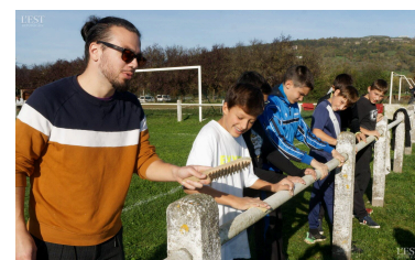
Décapage avant réfection.

La sortie au parc Walygator « spécial Halloween » a été très demandée. Sortie cinéma, randonnée dans les Vosges, futsal, pour les autres jours..., l'équipe d'animation essaie de répondre aux souhaits des jeunes. ■