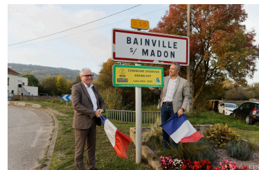
Un label qui salut les efforts de la commune.

principalement aux enfants, jeunes et moins jeunes. La pancarte désignant le village, comme commune sportive du Grand Est, label attribué par le Comité Olympique, pour une durée de 4 ans, fut apposée ensuite sur le panneau signalétique de Bainville, route de Xeulley. Dans son allocution, le maire a énuméré les projets sportifs envisagés pour la commune avec l'installation d'agrès, d'un parcours de santé et la création d'un skatepark. ■