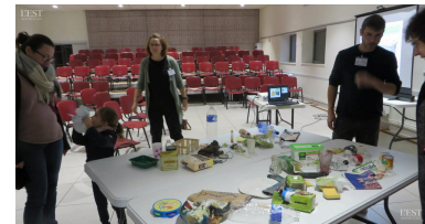
Comment faire pour changer les habitudes ?

Une mise en situation collaborative a permis aux participants, peu nombreux à cette soirée, de s'interroger et rectifier leurs habitudes de tri, avant un temps d'échange avec les participants. ■