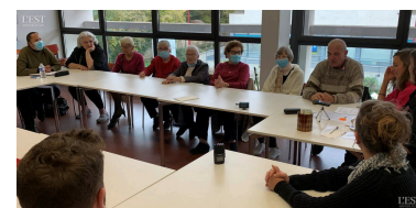
Les ateliers Virgule ont animé une séance de partage de souvenirs avec un groupe de seniors et de lycéens.