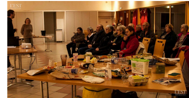
Les habitants écoutent les explications des ambassadeurs.

déchets verts sont à votre disposition. ■