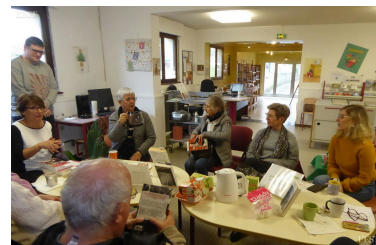
Un bel après-midi d'échange et de partage.

Prochaine séance samedi 11 mars à la médiathèque. ■