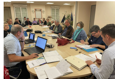
Les élus et des habitant(e)s de Pont-Saint-Vincent se sont réunis en mairie pour délibérer ou assister au conseil municipal.

Les 36 cases du columbarium actuel du cimetière étant toutes occupées, le conseil municipal accepte l'acquisition d'un ensemble de 3 nouveaux columbariums et d'un puits du souvenir, et valide les deux devis de la société CIMTEA pour un montant de 15 392,40 € TTC et 3 396 € TTC ■