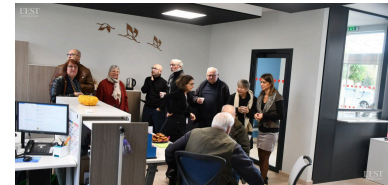
De nouveaux bureaux lumineux et fonctionnels.

autour d'un café et viennoiseries. Les travaux ont été longs, le chantier avait commencé en 2021, on connaît la lenteur des marchés administratifs, et la Covid n'a pas arrangé les choses. Montant des travaux, environ 70 000 €. ■