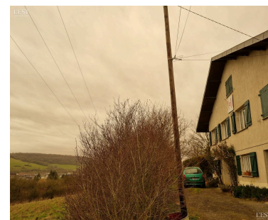
Neuves-Maisons, ce mardi 15 mars. C'est au pied de cette maison que doit être aménagé le futur lotissement géant.