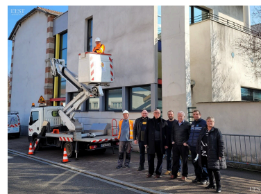
Action prioritaire de la municipalité, de ses services techniques et de police municipale : la vidéoprotection ici l'école Émile Zola.

collectivité. Et on a pu constater une amélioration de la situation. » ■