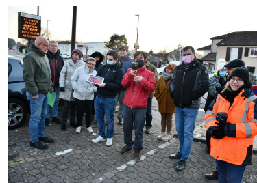
Des habitants soucieux de réduire les dépenses énergétiques de leur maison.

LER propose une palette d'aide sur mesure, selon les revenus, les conditions du demandeur, les besoins en travaux. ■