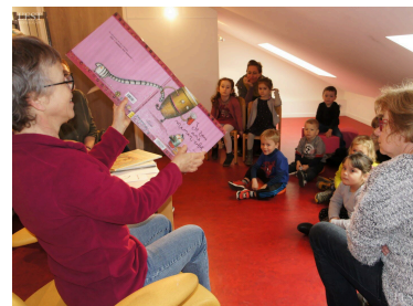
Les enfants apprécient les histoires. Les enfants apprécient les histoires.

Les accords de Cathy à la guitare ont sonné la fin de l'animation. ■