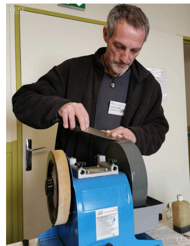
Dépanneur spécialisé dans le remoulage des couteaux.

taawashi (éponges réutilisables) à partir de vieux tee-shirts. ■