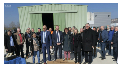
Lancement officiel pour le lancement des travaux du futur siège de la communauté de communes de Moselle et Madon.

une ancienne maison d'ingénieur de l'usine, peu visible, dans une impasse localisée dans un quartier résidentiel, et sur 3 niveaux. Pour un coût d'environ de 5 millions d'euros le bâtiment sera livré fin 2023 ■