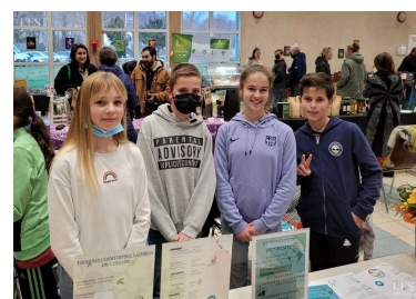
Les jeunes du club ados ont tenu leur place.

Le prochain marché communautaire se tiendra le 1er avril à Pulligny. ■