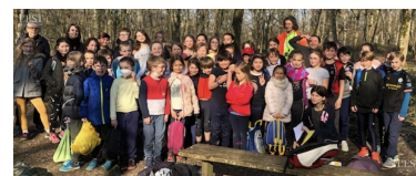
Les 5 e 4 du collège Callot de Neuves-Maisons étaient ravis de leur participation et de leur course.

au sein du Centre intercommunal d'action sociale Moselle-Madon. Organisateur de l'évènement et compte tenu des restrictions des deux années précédentes, il ne pouvait rêver mieux comme concrétisation de tous les efforts fournis par ces champions en herbe. Une satisfaction partagée par les jeunes et les adultes (enseignants et parents) présents. ■