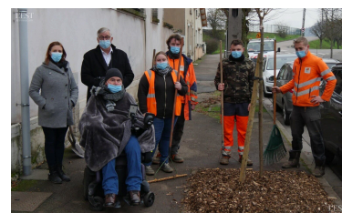
Les arbres restent une valeur sûre en termes d'environnement.

Ces essences ont été choisies selon leur taille adultes, leur rusticité (résistance au froid et au chaud) et leur capacité à capter le CO2. ■