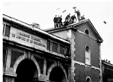
A l'aube des années 2000, Nicolas Drolc met la main sur l'un des premiers reportages de son père, photographe de presse.