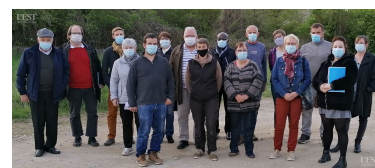
Les participants au marché et l'équipe municipale qui l'a mis en place.

Le jour J, un panier garni par les commerçants sera à gagner. Deux musiciens de l'opéra de Nancy animeront le marché. Aux Chalinéens de le faire vivre ! ■