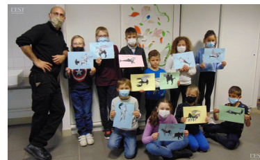
La mythologie fascine les enfants et nourrit leur imaginaire.

Des activités différentes et variées sont la nouvelle ligne des mercredis récréatifs au FJEP. ■