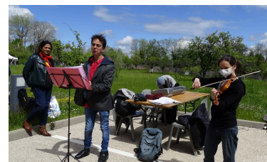
Le conte en musique, un instant magique. le conte, la musique, un instant magique

pressés devant les stands pour s'informer sur les liens nature et santé. ■