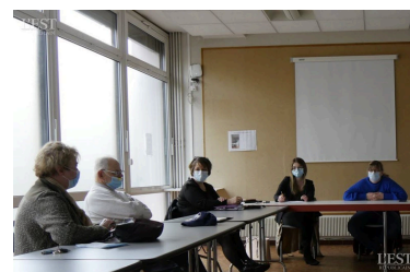
Les premières réunions ont déjà eu lieu, d'autres sont à venir.

Les réunions de préparation du pass ont commencé et se poursuivent. Si vous avez plus de 65 ans et que vous souhaitez donner votre avis, vous pouvez contacter le CCAS au 03 83 47 85 37 ou la résidence d'autonomie André-Clerbout au 03 83 47 16 03. ■