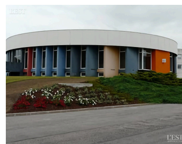
L'EPF Grand Est porte 80 % des dépenses (100 % pour le désamiantage) et 20 % sont à la charge de la CCMM soit 300.000 €.

Dans ce cadre, l'opération de déconstruction sera réactivée. Il a précisé que pour ces travaux, l'EPF Grand Est porte 80 % des dépenses (100 % pour le désamiantage) et 20 % sont à la charge de la CCMM soit 300.000 €. ■