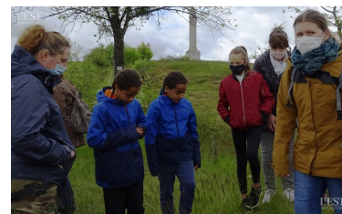
Balade découverte de la nature au pied de la colonne Barrès.