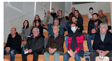
Acteurs et partenaires dans l'amphithéâtre de la Cité des paysages du conseil départemental 54 à Sion.

La démarche s'adresse à tous : « Même sur les balcons, il est possible de mettre des plantes mellifères. » ■