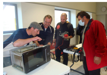
Quelques astuces suffisent pour réparer un four.

savon noir. Contact : Dominique Sacco au 06 13 48 49 00. Les bénévoles sont accueillis à bras ouverts. ■