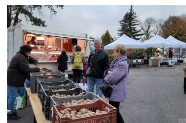
Une dizaine de commerçants locaux ont participé.

et propose des alternatives artisanales au jetable, depuis les protections hygiéniques jusqu'aux accessoires de cuisine. Un marché intéressant mais qui, vu le temps maussade, n'a pas connu l'affluence des grands jours. ■