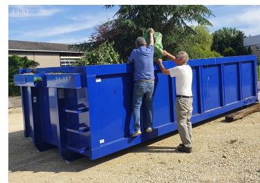
L'accès aux deux bennes de déchets verts a été facilité.