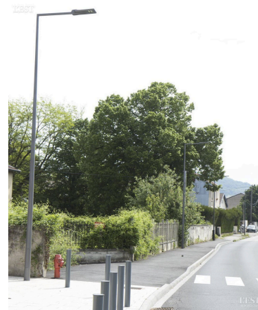
La mise en place des nouveaux éclairages sera effective sur toute la ville en 2023.

L'utilisation de cet éclairage rend possible l'ouverture vers une « ville intelligente », qui peut se matérialiser, notamment, avec détection de présence ■