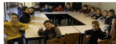
Ce CMJ sera composé de neuf jeunes âgés de 9 à 13 ans, élus pour une durée de deux ans.

pour une durée de 2 ans ; il sera mis en place à la rentrée. La mission première du jeune élu(e) est de représenter les jeunes auprès de la municipalité. Un règlement est établi afin d'en déterminer le cadre : objectifs, composition, déroulement des élections, commissions... ■