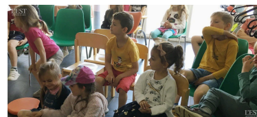
Les enfants du centre des Bainvi'loups ont profité de cette heure du conte.