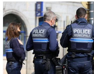
Le maire de Messein souhaiterait créer une police municipale avec les communes voisines.