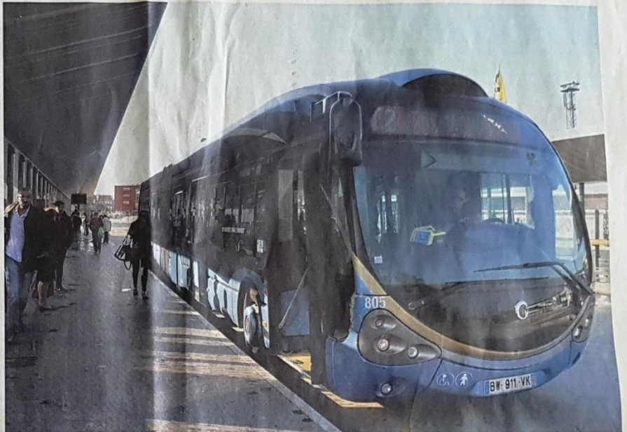
Un bus de la communauté urbaine de Dunkerque, en septembre.

Dans sa ville, c'est son prédécesseur, lui aussi maire de droite, concessionnaire automobile, qui a lancé le transport public gratuit en 2001. Bilan : la fréquentation a triplé entre 2001 et 2017, atteignant 5 millions de voyageurs par an, dont 40 % de jeunes de moins de 18 ans. « Le service est déficitaire de 900 000 euros par an, explique Gil Avérous. Mais ce que l'on ne