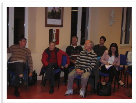
Des passionnés de vergers à l'heure du bilan