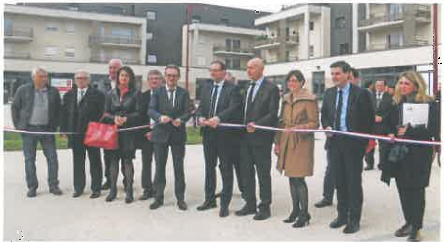
La Filature, vaste ensemble de commerces, de bureaux et de logements, vient d'être inauguré à Chaligny.