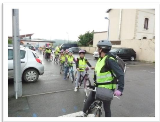
Les élèves de CE2 au CM2, au départ du groupe scolaire.