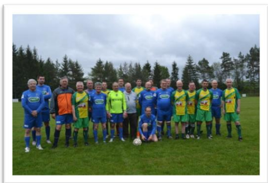
Les jaunes du Toulais-Sud et les bleus de Neuneu rois du fair-play.

Une belle idée de ramblement a germé suite au nouveau découpage géographique des communautés de communes du Pays de Colombey et de Moselle et Madon qui, au fil du temps, tissent des relations étroites avec des projets communs.