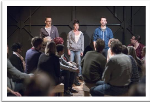
Les comédiens du spectacle Fracasse

Jeudi et vendredi dernier, deux soirées ont été consacrées à la représentation théâtrale du spectacle Fracasse ou la révolte des enfants des Vermiriaux, dans le cadre du cycle Grandir. Ce spectacle est le produit d'un partenariat entre plusieurs acteurs : le Labo en Lorraine, le Centre culturel - Médiathèque - Ludothèque la Filoche, la Cie des ô et Sarbacane.