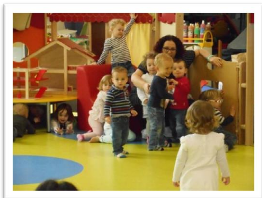
Les enfants en train de jouer