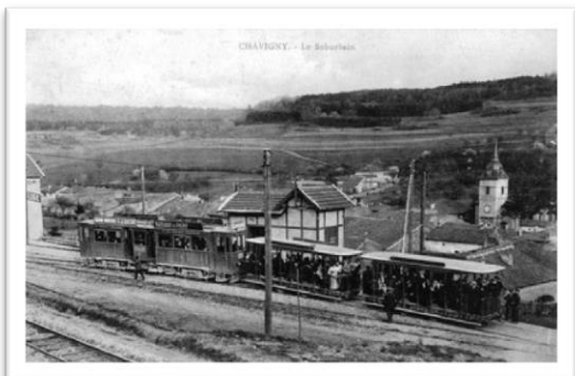
Chavigny, sur la ligne de tramway reliant Nancy àNeuves-Maisons.

1900. À l'origine des lignes suburbaines, trois lignes de tramway qui reliaient Nancy aux bassins de Pompey, Neuves-Maisons et Dombasle. Nous sommes au début du XXe siècle, en plein essor industriel. Entre-temps, elles sont remplacées par des lignes de bus. C'est à cette époque qu'un premier petit arrangement avec la loi a été opéré.