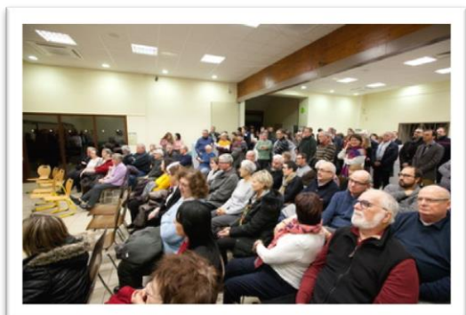
Le public applaudit l'arrivée de la fibre.

Cette nouvelle année débute avec l'achèvement des travaux rue de l'Église et l'enfouissement des réseaux. Avec un projet d'appartements réservés aux seniors.