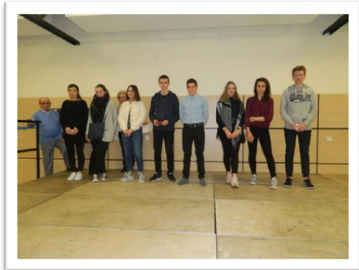
Les neuf diplômés.

Lors de ses vœux, le maire a parlé de l'urgence de faire des travaux dans les écoles et de doter l'école primaire de tablettes numériques. Ces projets seront soumis au conseil municipal lors du vote du budget.