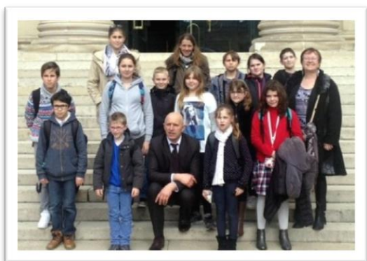
Dominique Potier et le conseil municipal des jeunes Chaviniens.

Lors des dernières vacances scolaires, les nouveaux élus du conseil municipal des jeunes, invités par Dominique Potier, député de la circonscription, se sont rendus à Paris en bus pour visiter l'Assemblée Nationale. Les jeunes ayant répondu à l'invitation, Dominique Potier, heureux de les accueillir, leur a fait visiter des lieux bien connus de l'Assemblée Nationale ; en particulier le palais Bourbon où ils ont découvert et pénétré dans l'hémicycle, les députés n'étant en séance. La visite s'est poursuivie par celle