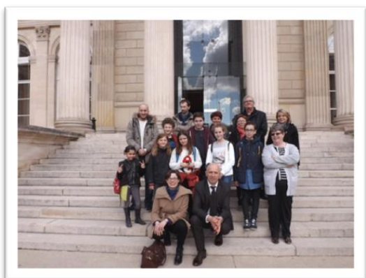
Les animateurs, les élus et les CMJ sur le parvis de la cour d'Honneur