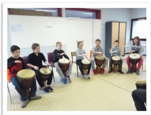
Un petit groupe motivé en action devant leurs djembés.