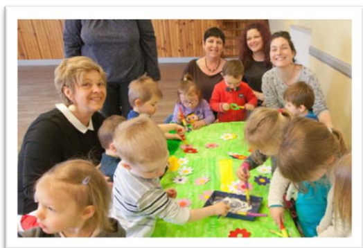
Les enfants ont réalisé une fresque.

C'est une matinée d'éveil aux couleurs du printemps qui attendait les assistantes maternelles et les petits de 0 à 3 ans dont elles ont la garde, jeudi matin à la salle des fêtes. Deux nounous très assidues confient leurs impressions sur ces rencontres : « Venir avec les enfants, pouvoir parler avec d'autres au lieu de rester chez soi, cela nous fait du bien. Et puis les enfants profitent de nombreux jouets, les activités proposées par les animatrices sont variées. Ils ont un grand espace, la salle est grande et accueillante et