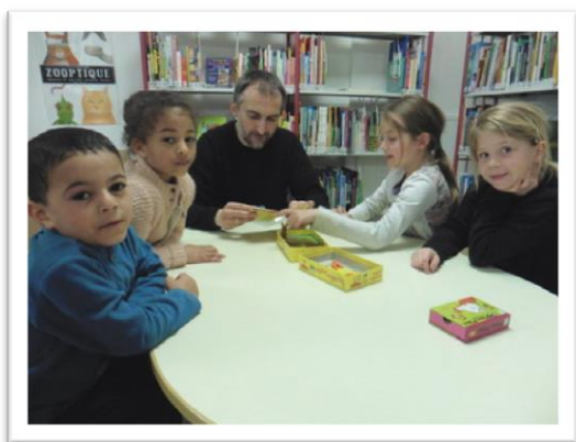
Le plaisir de jouer pour les petits comme les grands.

Dans le cadre des séances thématiques organisées par la structure intercommunale La Filoche, une animation sur les jeux ponctués d'histoires s'est déroulée à la médiathèque de Richardménil. Les enfants ont pu découvrir un certain nombre de jeux de sociétés adaptés à leur âge. Les jeux du lynx, du corbeau ainsi que les jeux d'adresse ou les jeux en bois ont ravi les plus petits et les plus grands. Ensuite, le talent de la conteuse a fait son effet avec une histoire de trolls, d'ogres et de champignons magiques.