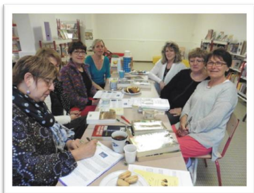
Des lectrices attentives.

Samedi, lors de leur rencontre, les fidèles lectrices de la médiathèque de Richardménil se sont retrouvées pour un coup de cœur café où chacune a pu exprimer son avis sur les livres lus durant l'hiver avec la littérature américaine comme fil rouge.