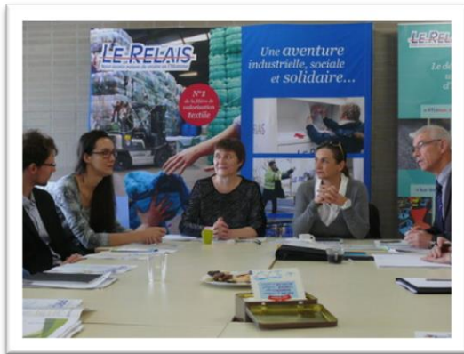
Une partie du groupe de travail.