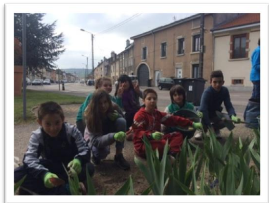
Les jeunes au travail