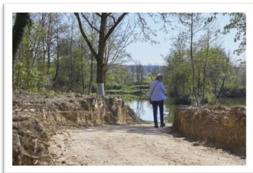
Les travaux réalisés par l'association de pêche locale font polémique à Messein.

L'association de pêche de Messein a procédé à des gros travaux en bordure de deux étangs. Sans autorisation de la commune. D'où la colère du maire et de certains habitants.