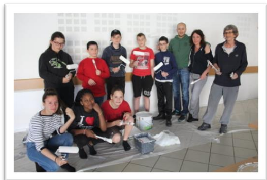
Les jeunes peintres