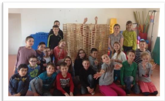
Les CM des Alisiers.

Trois demi-journées ont été consacrées à la classe des CM des Alisiers, aux jeux de construction, en partenariat avec la section ludothèque de la Filoche. Logique, prise de risques, précision, réalisation de montages d'après des notices, parfois même les yeux bandés et sous la direction d'un coéquipier... L'esprit d'équipe est ainsi indispensable ! Un apprentissage ludique à la citoyenneté, à l'acquisition de valeurs de « faire ensemble » et à la coopération.