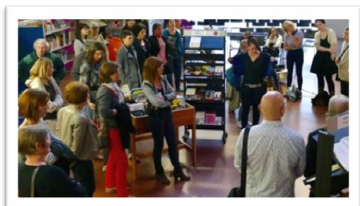
Le cycle grandir de la Filoche présenté au public.

Vendredi soir, la Filoche inaugurait le cycle « Grandir » et présentait son programme au public. Si l'enfant sera au coeur du nouveau thème de la médiathèque, les spectacles, les expositions et les ateliers aborderont tout ce qui se cache derrière le mot grandir.