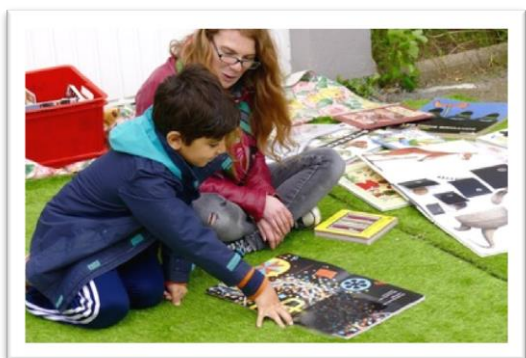
L'atelier lecture interactive du ludobus a eu beaucoup de succès

Samedi 14 mai après-midi, le Secours populaire a invité le ludobus de la Filoche, lors de sa traditionnelle distribution alimentaire.