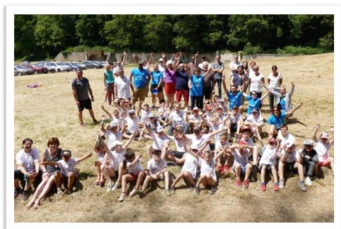
Une ballade d'été animé grâce aux différents ateliers et jeux mis en place