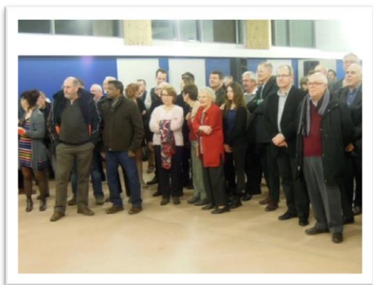
Les invités attentifs durant l'allocution du maire.

Vendredi en début de soirée a eu lieu salle André Chardin la cérémonie des vœux pour l'année 2016. Elle a rassemblé 200 personnes, maire et élus de la communauté de communes Moselle et Madon, représentants de la gendarmerie, des services de secours, des associations communales patriotiques, culturelles sportives, des associations intercommunales, enseignants, personnel communal, ainsi que de nombreux habitants, en particulier ceux installés durant l'année dans la localité.