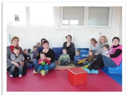
Les enfants et les assistantes maternelles sur le «raconte tapis».